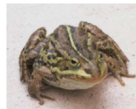
Лягушка 10 см