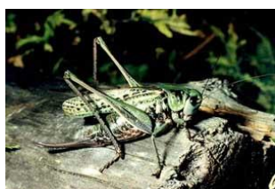
Кузнечик 3 см

Задание 4. Сравни размеры животных. Определи, кто всех длиннее .