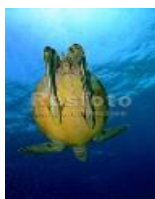
Прилипалы на черепахе