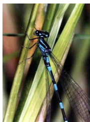
Стрекоза 4 см