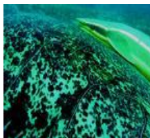
Прилипала на камне